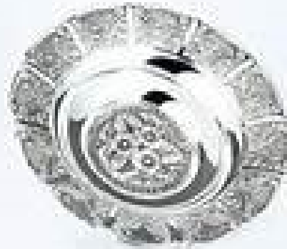
Een zilveren schaal

Welke Vorst bracht op de vierde dag zijn offer ?