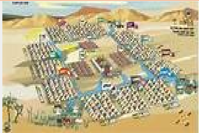
Kamp Israel rondom de Tabernakel in de woestijn

Welke twee stammen behoorden tot de grootste stammen en welke twee stammen behoorden tot de kleinste stammen ?