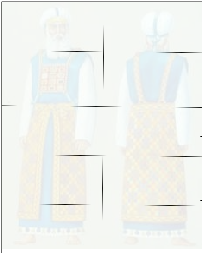
De puzzel en het zesde puzzelstukje