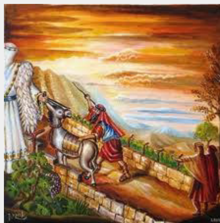
Bileam en zijn ezelin onderweg

Wat verzocht Balak, de koning van Moab, van Bileam?